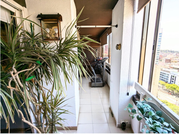
Terraza con vistas 1