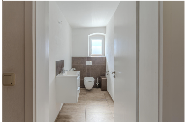
1. OG Wohnung Gäste WC