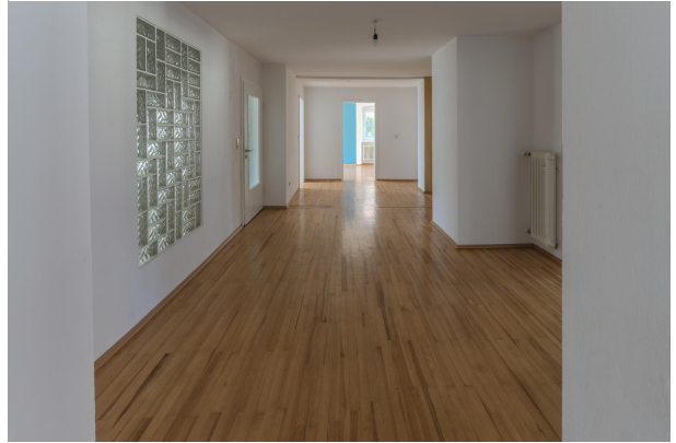
1. OG Wohnung Flur