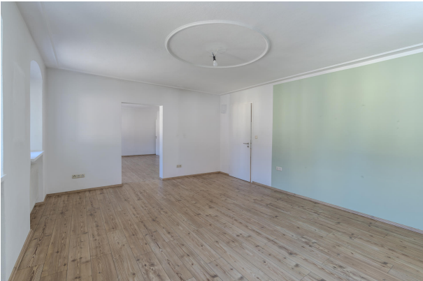
1. OG Wohnbereich