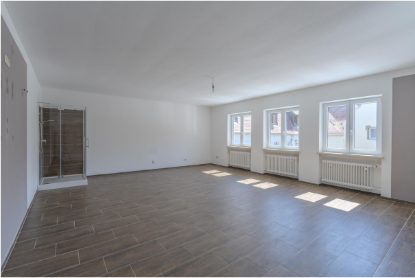
1. OG EZ Wohnung