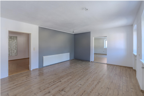
1. OG Wohnung Küche